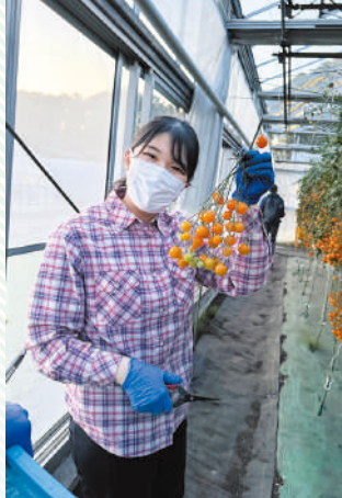
御料牧場内でトマトを収穫される愛子さま