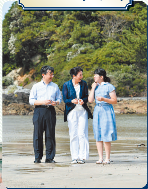
2018年8月、御用邸近くの海岸を散策される 天皇ご一家

伊豆漁業協同組合で話をされる上皇ご夫妻。 上皇さまは東日本大震災の影響で宮城県から 下田に移住した漁業者との対話も強く希望 されたそう