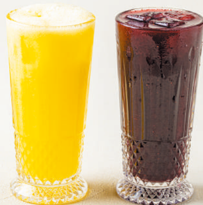
さっぱりとした味わいの「ウルトラ生ジュース」。みかん(左、400円)、ブルーベリー(右、500円)いずれもレギュラーサイズ