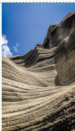
【写真左】千畳敷では小さな魚や貝類の姿も 【写真上】軽石や火山灰がつくる縞模様が見られる