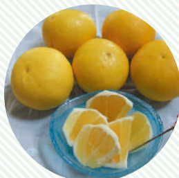
一番人気のニューサマーオレンジ

静岡県賀茂郡 河津町見高1266-31 ☎：0558-32-1134 ☎：ultra3nen.jp