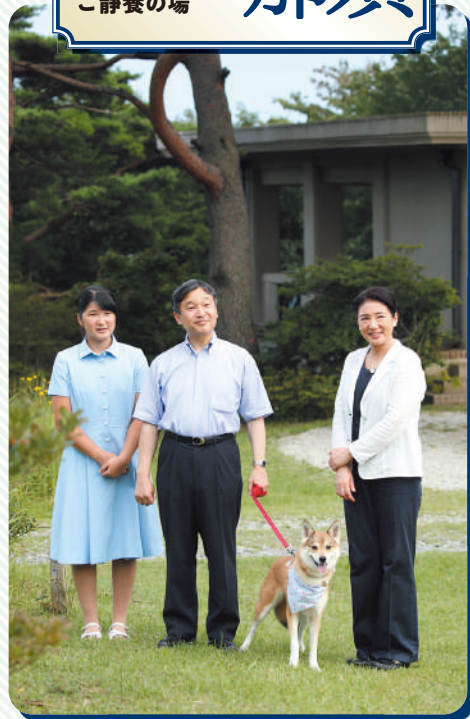
2018年8月、初めて那須御用邸の敷地内で取材に応じられた天皇ご一家