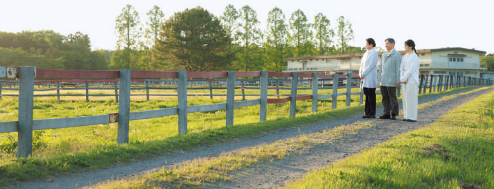
2024年5月、広々とした牧場をご覧になる静養中の天皇ご一家