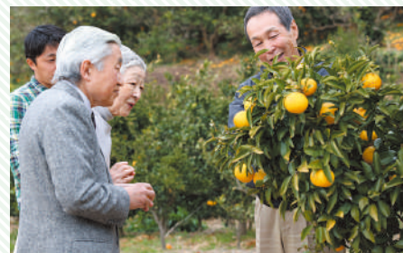
たわわに実った伊豆半島特産のみかん「ニューサマーオレンジ」をご覧になる上皇ご夫妻