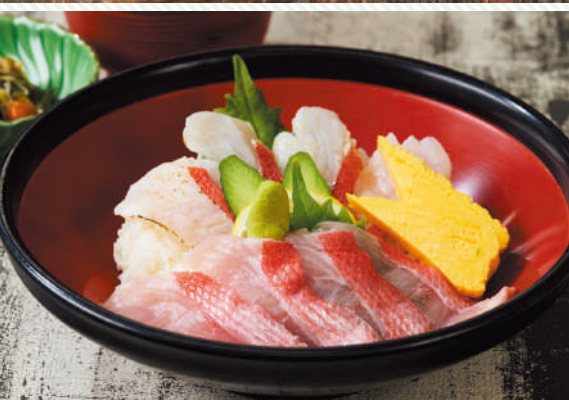
【写真上】水揚げ後に選別される、鮮やかな朱色が美しいとれたてのキンメダイ 【写真下】市場にある食堂「金目亭」で提供される一番人気の「金目三色丼」(1650円)

伊豆漁業協同組合で話をされる上皇ご夫妻。 上皇さまは東日本大震災の影響で宮城県から 下田に移住した漁業者との対話も強く希望 されたそう